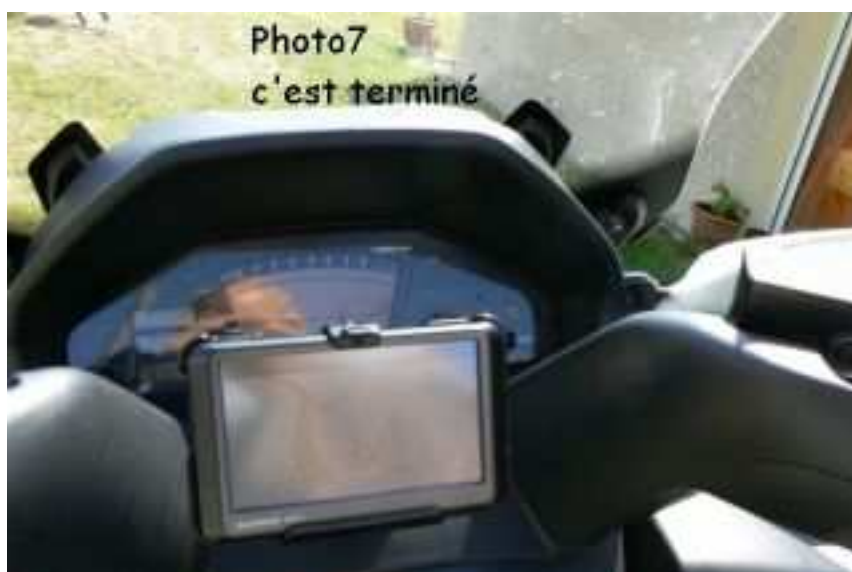
Et voilà l'ensemble terminé.