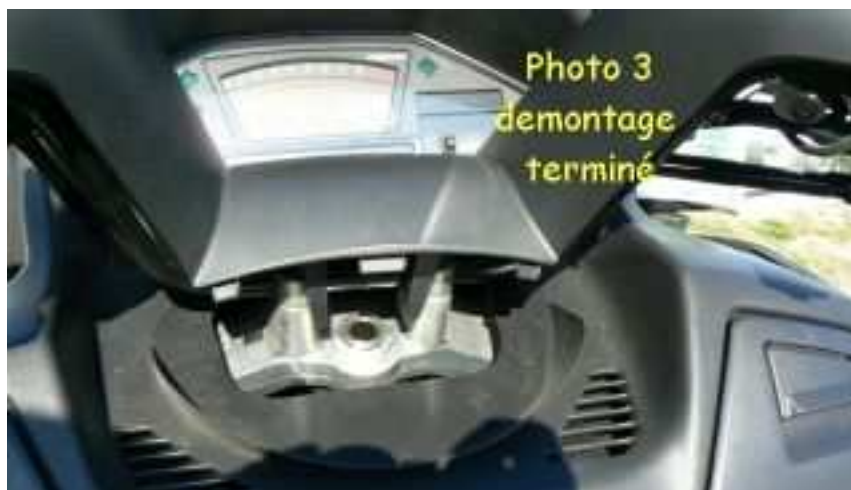
Vue du carénage démonté avant perçage d'un trou de 6 mm