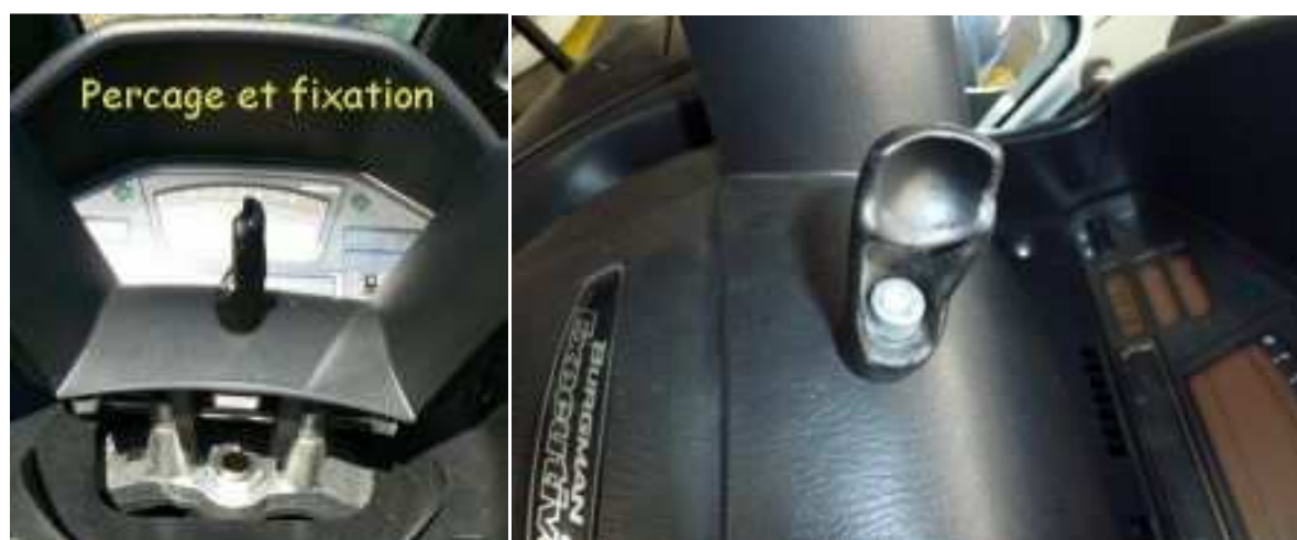
Vissage de la base RAM-B-200-1 sur le carénage. La tête de boulon est du côté de la base et l'écrou+rondelle à l'intérieur du carter.