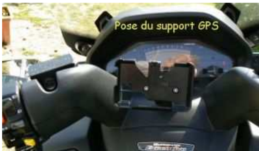
Pose du berceau GPS Nuvi 255W RAM-HOL-GA25U avec sa base RAM-B-238 sur le bras de serrage.