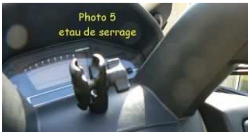
Base de serrage et d'articulation RAM-B-200-1 prête à recevoir la base avec boule anti-vibration RAM-B-238 du berceau GPS